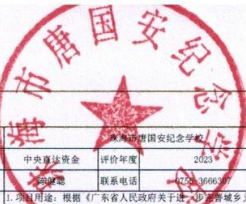
2023年区级项目支出绩效评价申报表