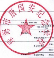
专项支出绩效自评表