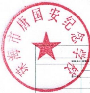
专项支出绩效自评表